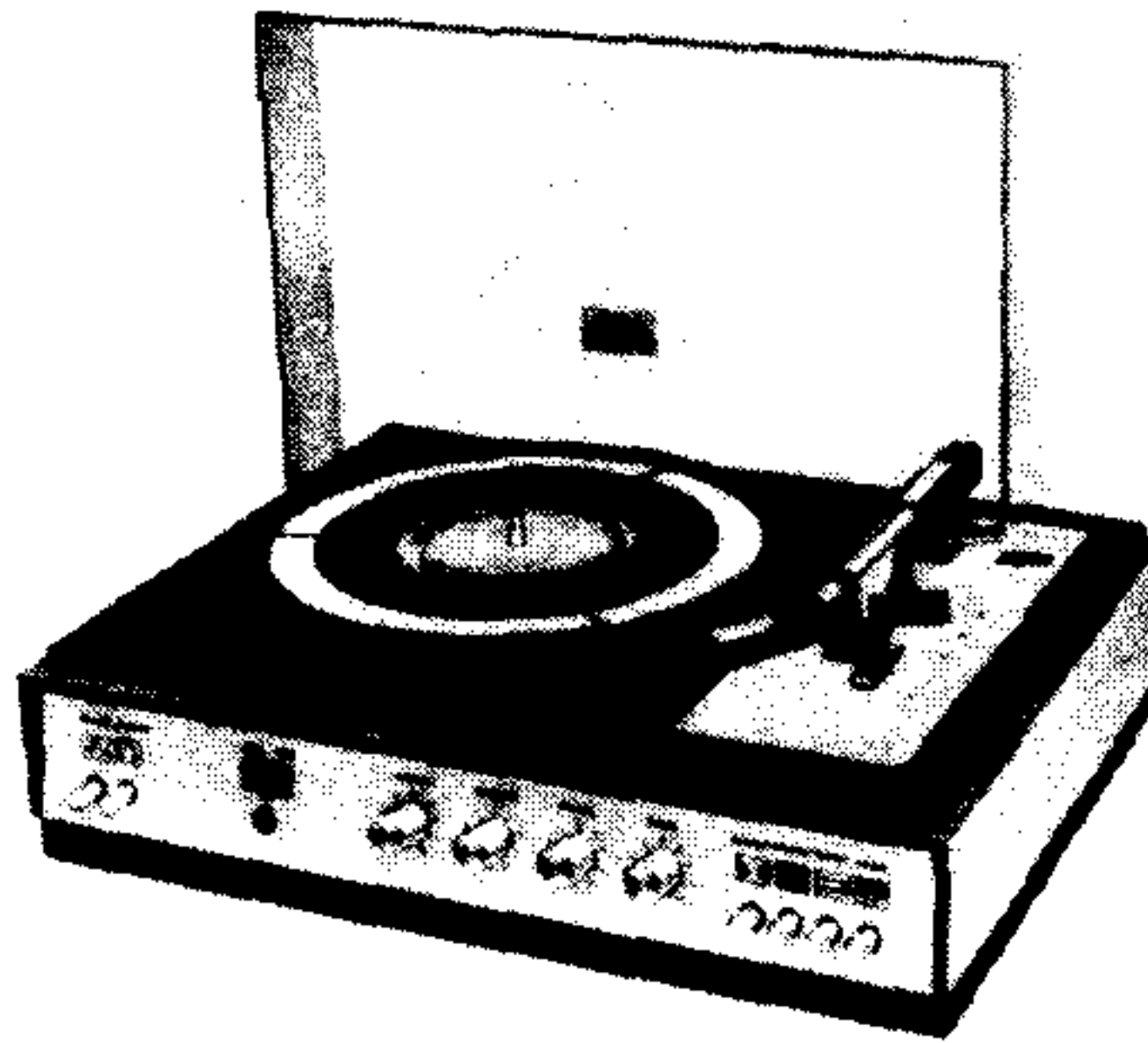
Stolní stereofonní gramofon NZC 130, výroba 1974 až 1976

Vstupní napětí (pro vybudění na jmenovitý výstupní výkon): pro piezoelektrickou stereofonní přenosku 2 \times 420 mV (impedance 2 \times 150 k \Omega ); vstup pro rozhlasový přijímač 2 \times 250 mV (impedance 2 \times 20 k \Omega ); vstup pro magnetofon 250 mV (impedance 20 k \Omega )